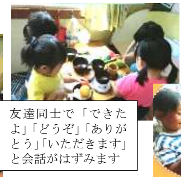
友達同士で「できたよ」「どうぞ」「ありがとうございます」「いただきます」と会話ははずみます