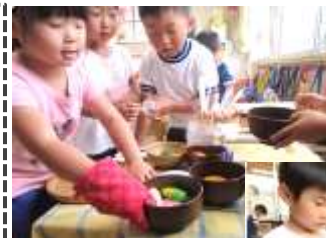
いろんな具材のお汁ができます

きく組の部屋の一角に、いつでもままごと遊びができるままごとコーナーを作りました。お家の方が家で料理をされている様子を真似したり、様々な素材を食材に見立てたり、いろいろなアレンジの料理を考えて作ったり、楽しんでいます。