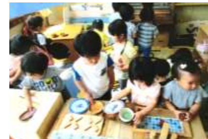
たんぼぼ組もあそびに来ました