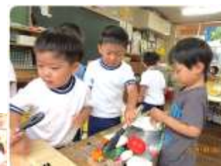
網とトングでBBQごっこ